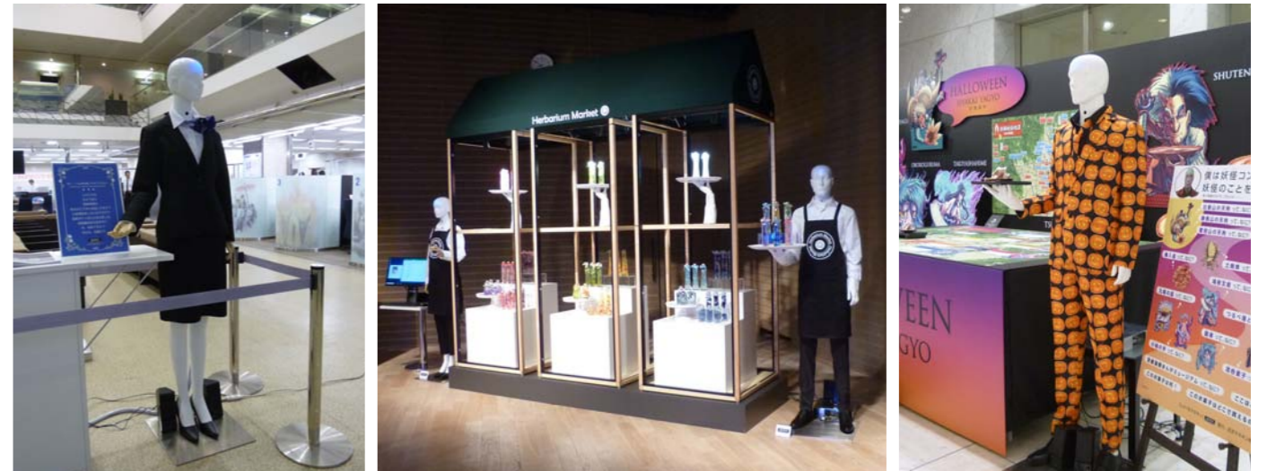
※トレイ用右腕オプション使用時