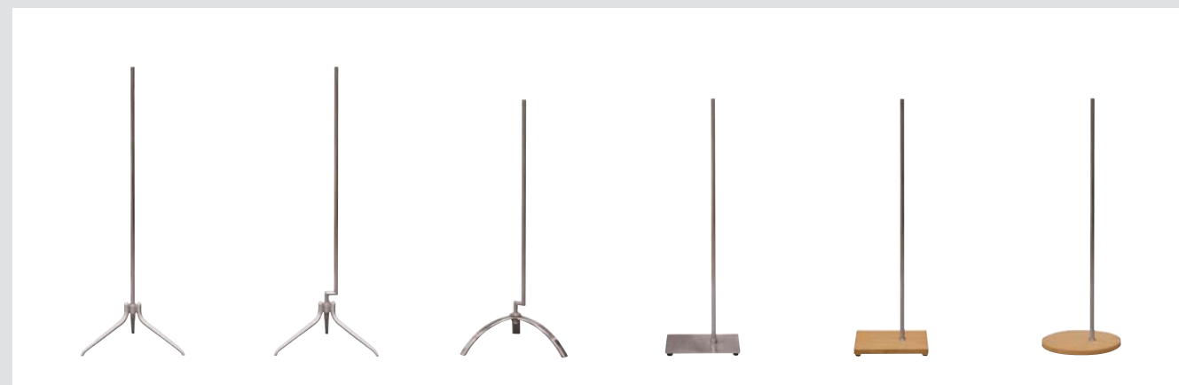
S 8 Width 420 Depth 370 Height 1300 支柱: Φ19.1 スチール/メラミン焼付Cr.メッキ S 8A Width 420 Depth 370 Height 1300 支柱: Φ19.1 スチール/メラミン焼付Cr.メッキ S 21 Width 450 Depth 380 Height 1160 支柱: Φ19.1 スチール/Cr.ニッケルサテンメッキ S 22 Width 330 Depth 330 Height 1125 支柱: Φ19.1 スチール/Cr.ニッケルサテンメッキ S 23 Width 330 Depth 330 Height 1120 支柱: Φ19.1 木/クリアー スチール/Cr.メッキ S 24 Width 360 Depth 360 Height 1110 支柱: Φ19.1 木/クリアー スチール/Cr.メッキ