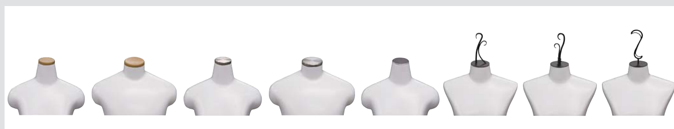
H17 (婦人) 木/クリアー H18 (紳士) 木/クリアー H19 (婦人) アルミ/生地 H20 (紳士) アルミ/生地 H22 (婦人) スチール/Cr.メッキ HZ1 (婦人) HZ2 (紳士) スチール/メラミン焼付 HZ3 (婦人) HZ4 (紳士) HZ5 (婦人) HZ6 (紳士)