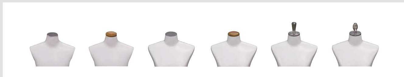
H 3A (子供) H 3B (子供) スチール/Crメッキ H 6A (子供) H 6B (子供) 木/クリアー H 1 (婦人) H 2 (紳士) スチール/Cr.メッキ H 4 (婦人) H 5 (紳士) 木/染色仕上げ H 7 (婦人) H 8 (紳士) アルミ/生地仕上げ H 9 (婦人) アルミ/生地仕上げ