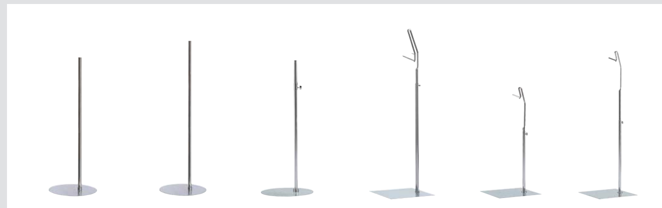
S 3 (子供) Width 350 Depth 350 Height 800 支柱: Φ19.1 スチール/Cr.メッキ Cr.メッキ H.L.(座板) S 27 Width 360 Depth 360 Height 1100 支柱: Φ25.4 スチール/Cr.メッキ Cr.メッキ H.L.(座板) S 31 Width 300 Depth 300 Height 750 支柱: Φ19.1 スチール/Cr.メッキ Cr.メッキ H.L.(座板) S 28 Width 340 Depth 340 Height 1135 ~ 1800 S 29 Width 275 Depth 275 Height 600 ~ 800 S 30 Width 275 Depth 275 Height 700 ~ 1000