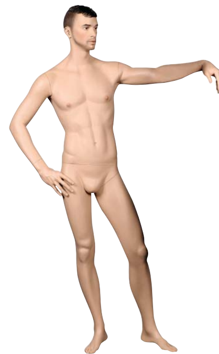
TEM17 Height 188.5cm Chest 94.0cm Waist 80.0cm Hip 93.5cm 靴サイズ 26.5cm スタンド [R][S]