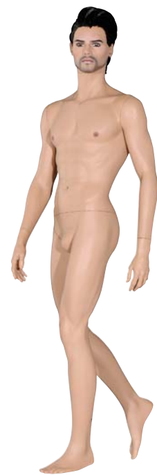
TEM1 Andrei Height 184.0cm Chest 102.0cm Waist 83.0cm Hip 93.0cm 靴サイズ 26.5cm スタンド [R][S]