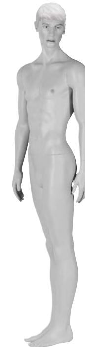
YR2 Tomak Height 184.0cm Chest 91.0cm Waist 83.0cm Hip 89.0cm 靴サイズ 26.0cm スタンド [R][S]