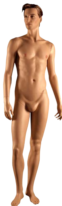
FC8 Kamil Height 188.0cm Chest 100.0cm Waist 80.0cm Hip 92.0cm 靴サイズ 27.5cm スタンド [R][S]