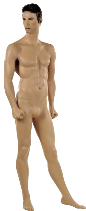
BOX11 Benjamin ■ Height 186.0cm Chest 100.0cm Waist 80.5cm Hip 90.5cm 靴サイズ 28.0cm スタンド [R][S]