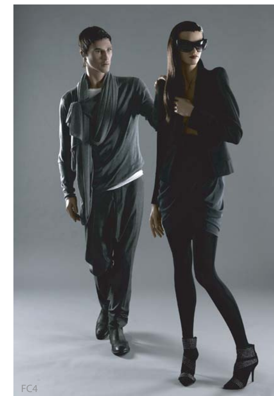
IN FOCUS シリーズ (FC6 のぞく) はサイドパイプも使用できます。