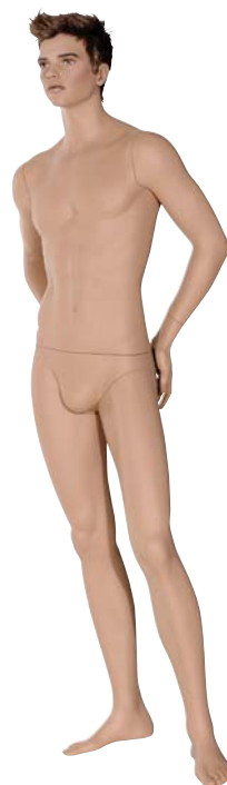
TEM15 River Height 188.0cm Chest 97.0cm Waist 84.0cm Hip 94.0cm 靴サイズ 26.5cm スタンド [R][S]